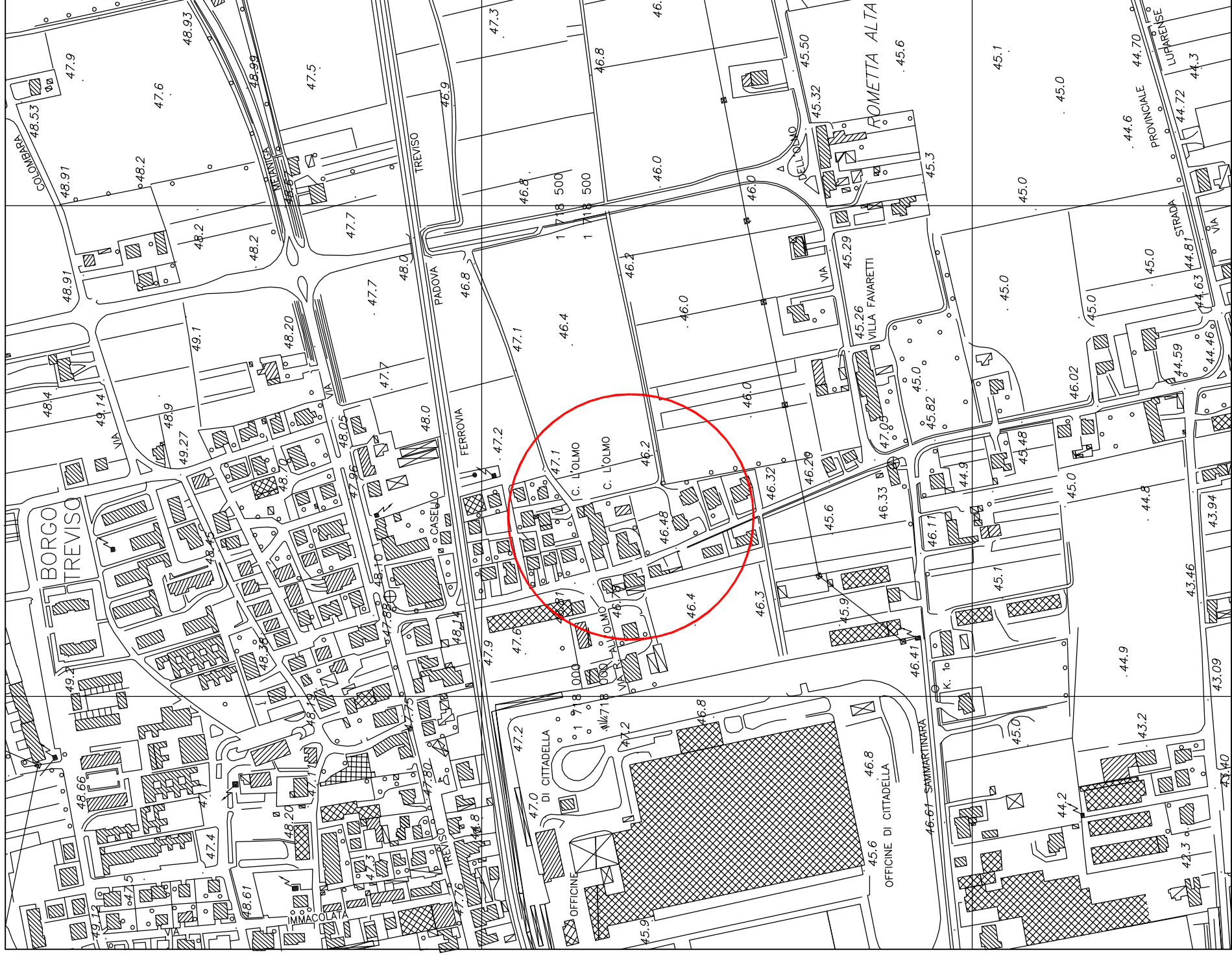
ESTRATTO AEROFOTOGRAFOMETRICO scala 1:5000