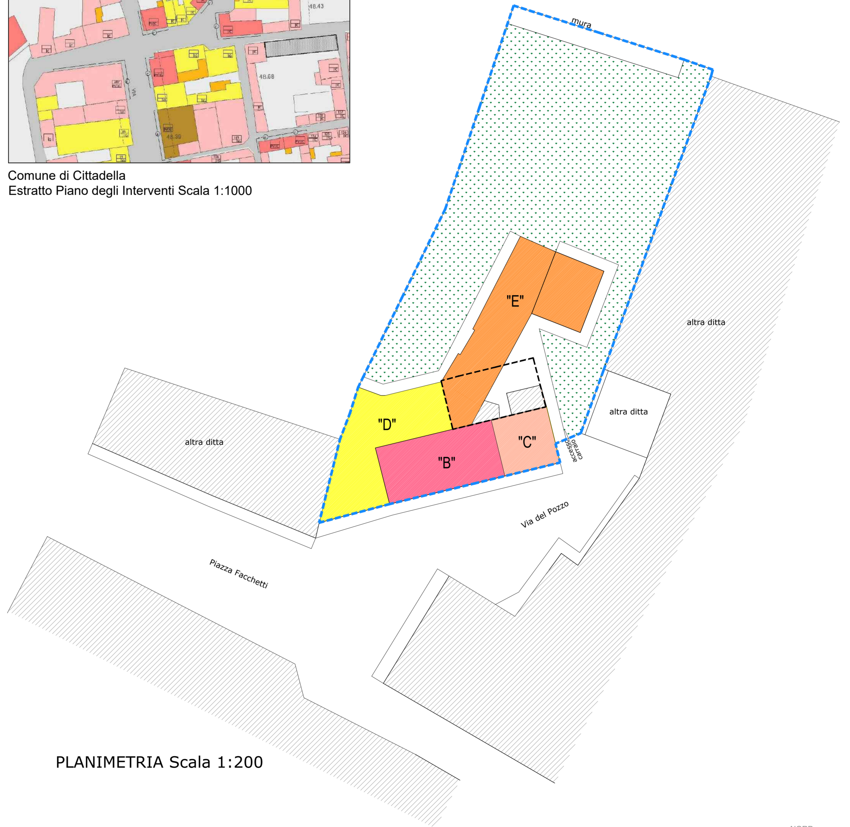
PLANIMETRIA Scala 1:200