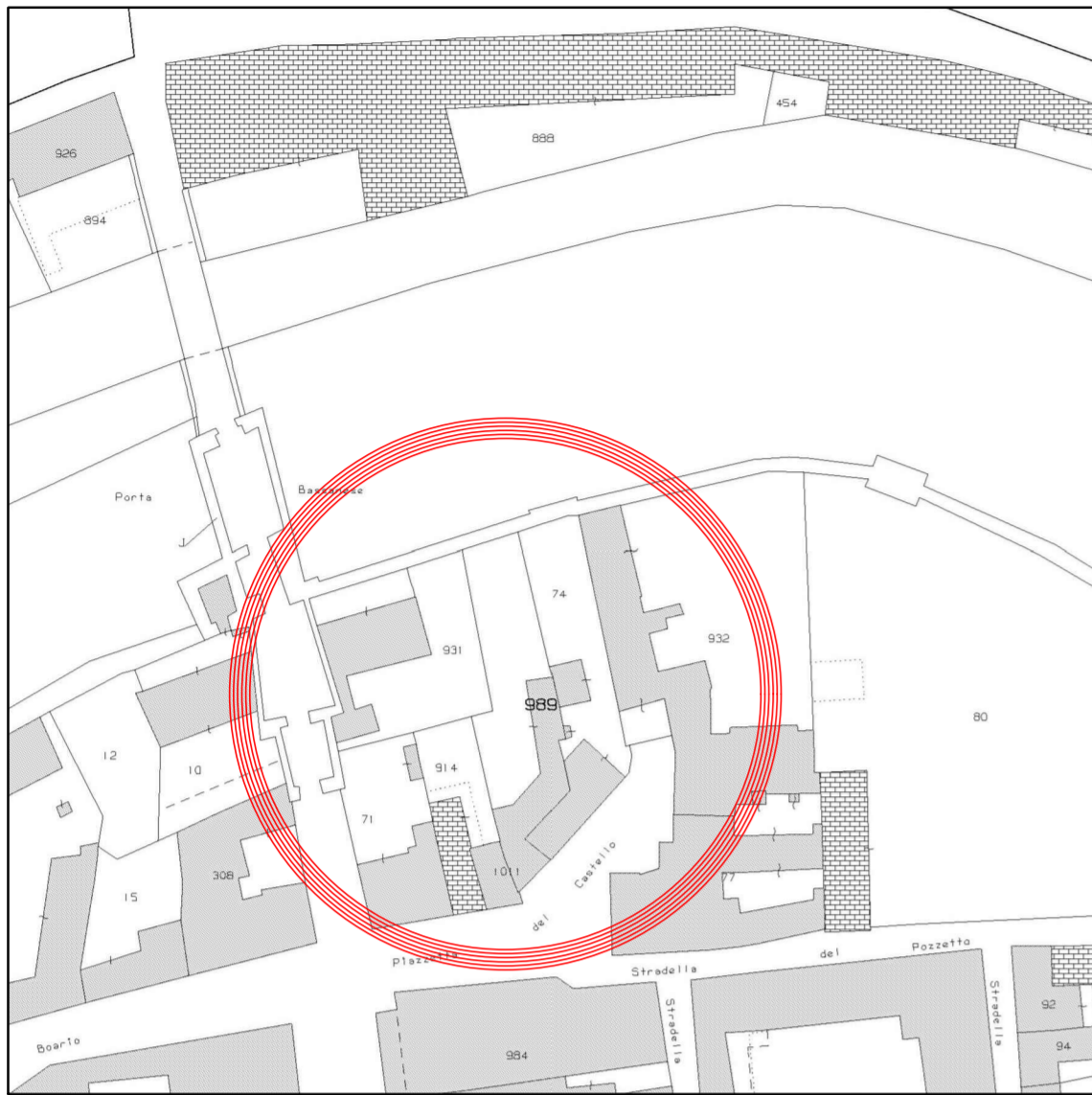
Comune di Cittadella Estratto di Mappa Scala 1:1000 N.C.T. Fg. 33 Mapp. n. 74 - 989