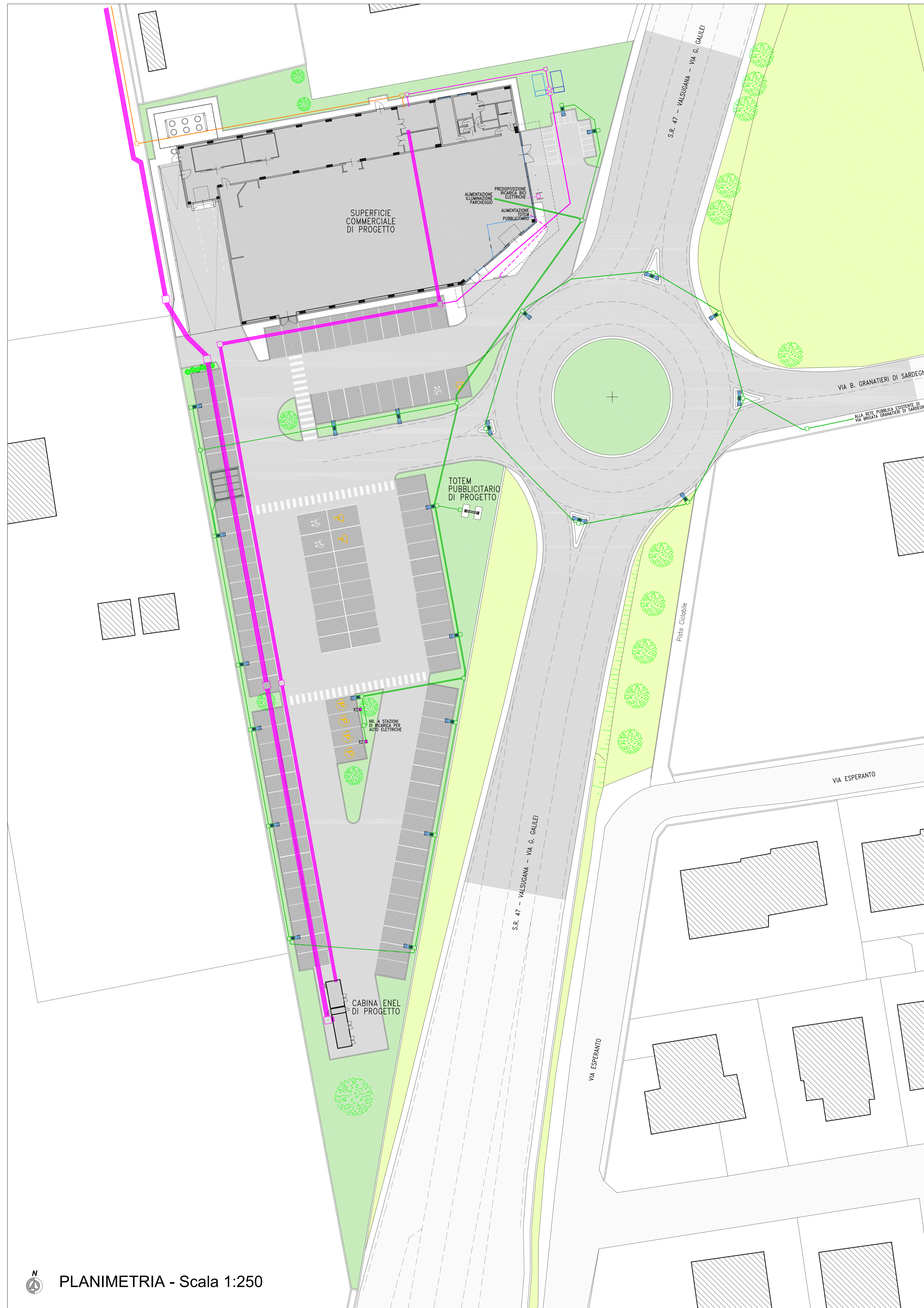
PLANIMETRIA - Scala 1:250